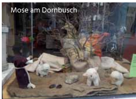
Mose am Dornbusch

„Meine Welt ist voller Fragen“ war das Thema, das in der Zeit vom 18.02. bis 21.02.2021 in unterschiedlichster Weise behandelt wurde. Einige dieser Fragen hat Naseweis der vielbelesenen Leseratte gestellt. Welche Antworten finden unsere Kinder auf diese Fragen?