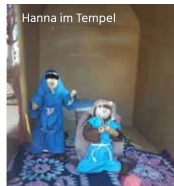
Hanna im Tempel

Hanna schüttet Gott ihr Herz aus und wird gehört, diese Geschichte stand am Freitag im Mittelpunkt. Wie fühlt man sich, wenn man verspottet wird? Was kann man tun? Vielleicht hilft ein kleines Kummerkästchen, in das stecken wir die Dinge, die wir Gott sagen möchten. Und wenn Gott an uns denkt, dann können wir auch an andere den-