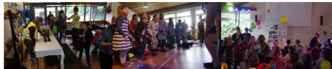
Jungschartag 2019 in Fellbach