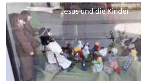
Jesus und die Kinder